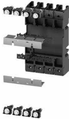
Steckereinheit Komplettbausatz Zubehör für: Leistungsschalter, 4-polig 3VA12