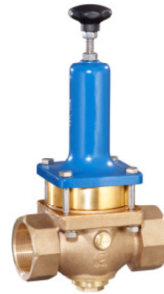
DN 40 - DN 50