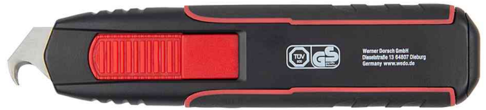
Safety-Cutter Double Side, mit Hakenklinge