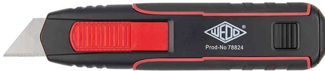
Safety-Cutter Double Side, mit 19 mm Klinge