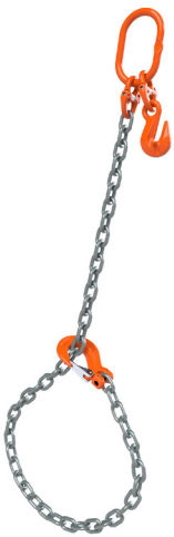
Schleufe mit Lasthaken