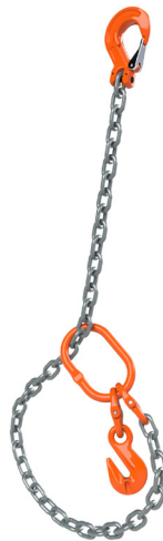
Schleufe mit Aufhängeglied