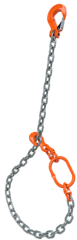
Feste Schleufe mit Verkürzungshaken