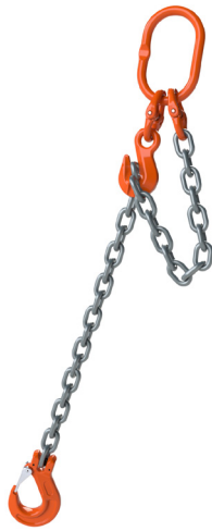
Verkürzung mit Verkürzungshaken