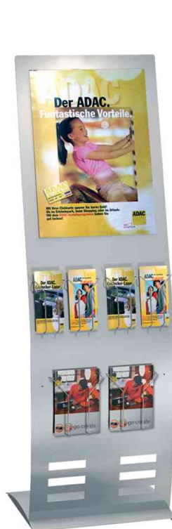
Visuel de référence: présente le produit en utilisation avec des accessoires facultatifs