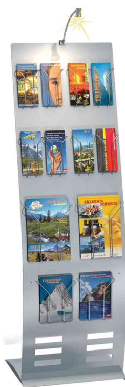
Visuel de référence: présente le produit en utilisation avec des accessoires facultatifs