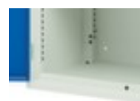
table de travail