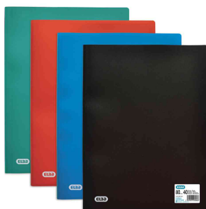
visuel de référence: Protège-documents INITIAL, choix des couleurs