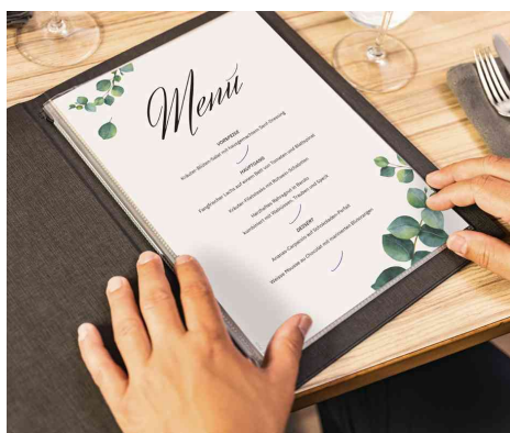
Visuel de référence : montre le produit en utilisation