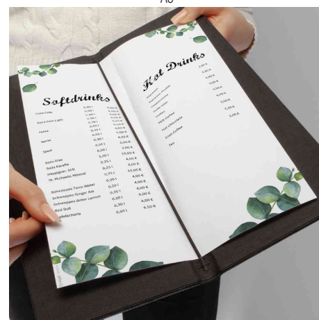
Visuel de référence : montre le produit en utilisation