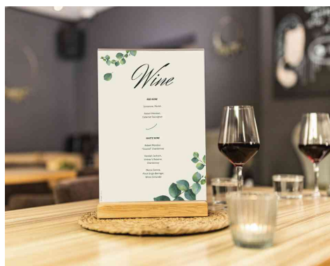
Visuel de référence : montre le produit en utilisation