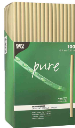
Schilf-Trinkhalme "pure", Verpackung