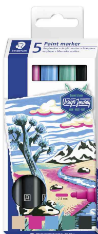
Marqueur acrylique paint marker Lumocolor, étui de 5