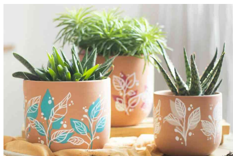
Idée de création : décorer soi-même des pots de fleurs