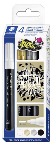
Marqueur acrylique paint marker Lumocolor, étui de 4

- pour écrire de façon couvrante sur presque toutes les surfaces claires et foncées comme le papier, le carton, le plastique, le métal, le verre, la céramique, le bois, la pierre, etc. et pour les décorer