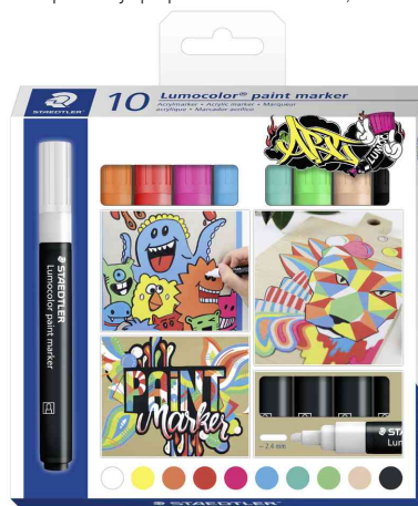
Marqueur acrylique paint marker Lumocolor, étui de 10