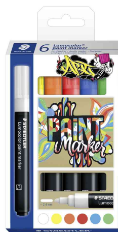
Marqueur acrylique paint marker Lumocolor, étui de 6