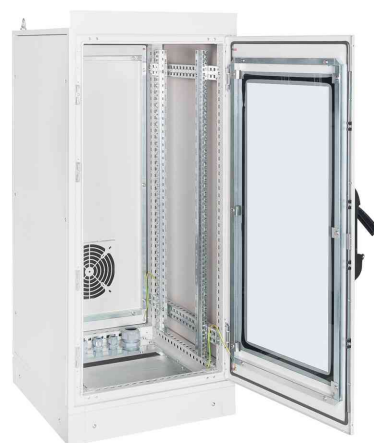
19" Industrie-Netzwerkschrank, mit aufgeklappter Fronttür