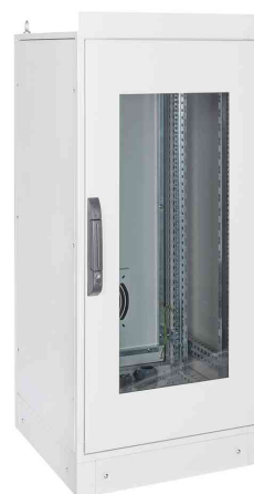
19" Industrie-Netzwerkschrank, 24 HE, Tiefe: 600 mm