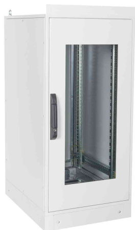
19" Industrie-Netzwerkschrank, 24 HE, Tiefe: 800 mm

- für den benutzerfreundlichen Einbau von aktiven und passiven Netzwerkkomponenten