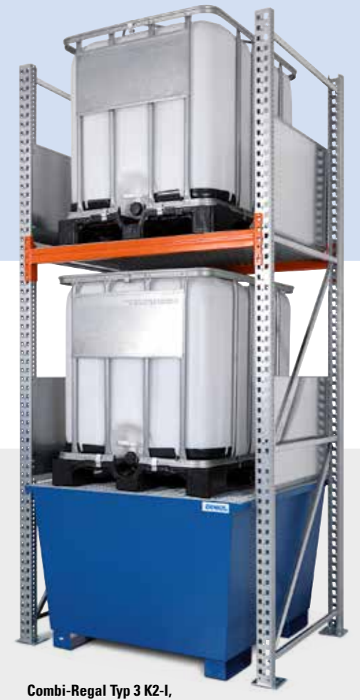
Combi-Regal Typ 3 K2-I, Grundfeld mit lackierter Auffangwanne, Bestell-Nr. 201-876-J9