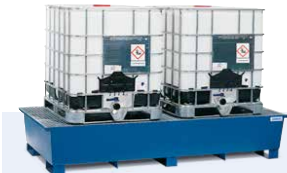
Auffangwanne Typ TC-2F, lackiert, als Lagerstation