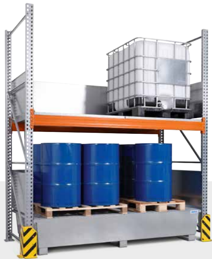
Combi-Regal Typ 3 K4-I, Grundfeld mit verzinkter Auffangwanne (Anfahrtschutzecken optional), Bestell-Nr. 199-647-J9