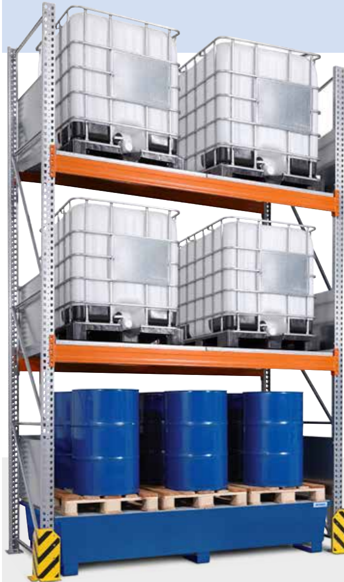
Combi-Regal Typ 4 K6-I, Grundfeld mit lackierter Auffangwanne (Anfahrtschutzecken optional), Bestell-Nr. 200-023-J9

i Alle Regale verzinkt für optimalen Korrosionsschutz