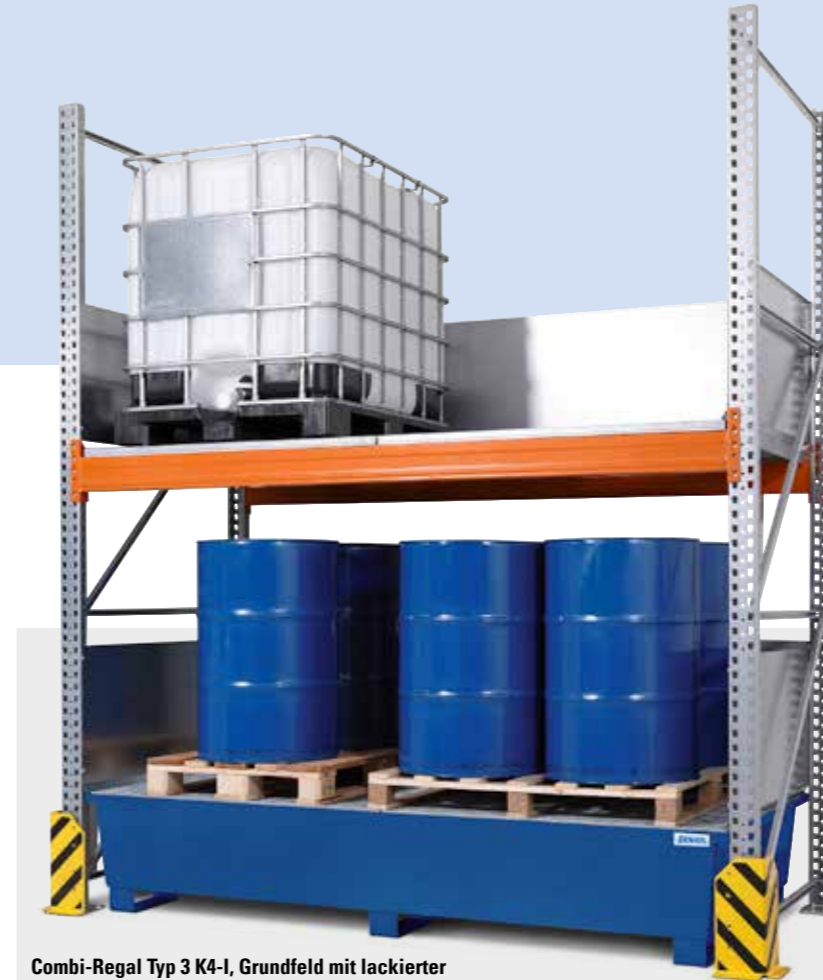
Combi-Regal Typ 3 K4-I, Grundfeld mit lackierter Auffangwanne (Anfahrtschutzecken optional), Bestell-Nr. 199-657-J9