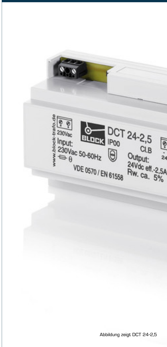
Abbildung zeigt DCT 24-2,5