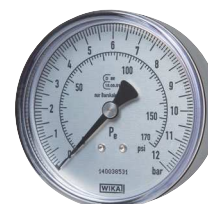
Typ HRFGS MANO