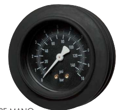
Typ HRF MANO