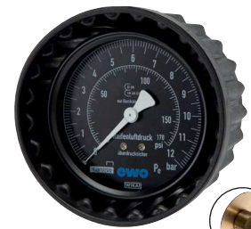
Typ HRFG MANO