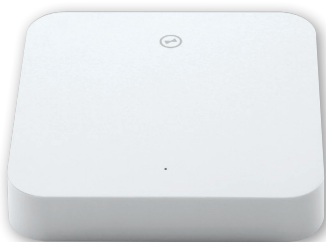
wibutler pro 2 Controller