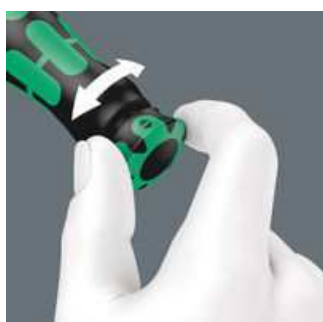
Mit hör- und fühlbarem Einrasten bei Erreichen der Skalenwerte.