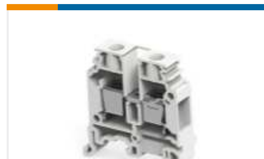
TE Teilnr.:1SNA115120R1700 M10/10