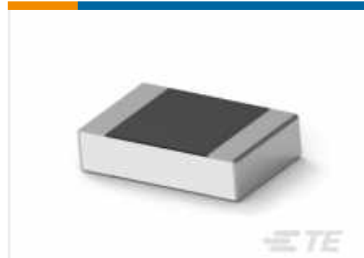
TE Teilnr.:1-2176377-0 RQ 0805 165K 0.1% 10PPM 1K RL