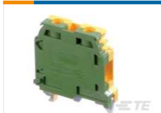
TE Teilnr.:1SNA165115R1000 M10/10.P