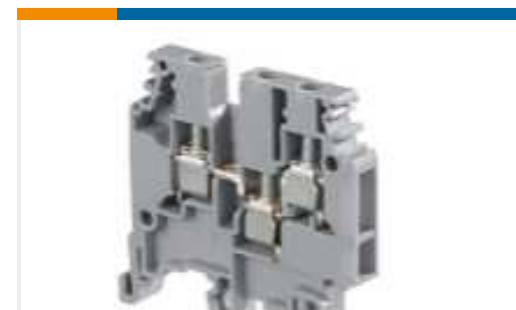
TE Teilnr.:1SNA115468R2000 M4/6.3A