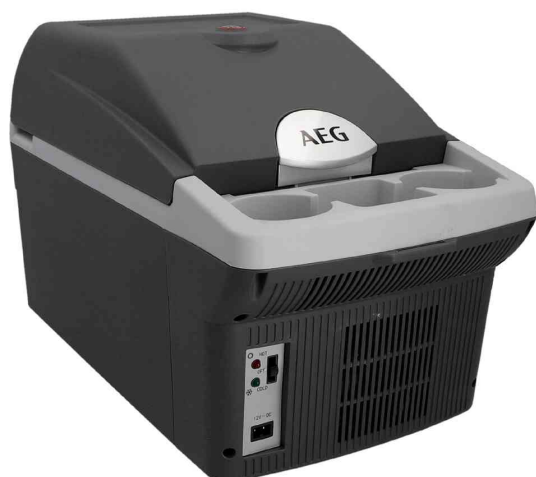
Glacière Bordbar BK 16