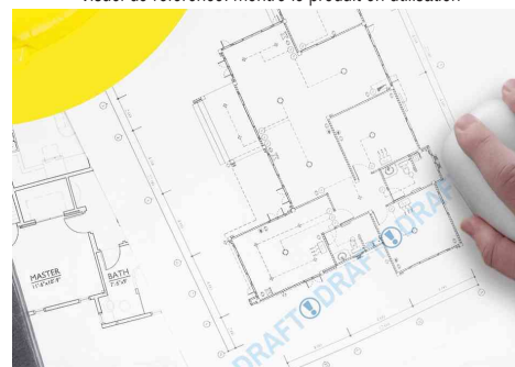
Visuel de référence: montre le produit en utilisation