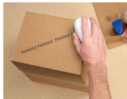
Visuel de référence: montre le produit en utilisation