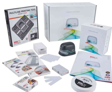
Imprimante mobile e-mark Professional - kit de démarrage