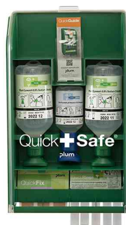
Station de premiers secours QUICKSAFE BASIC, vert