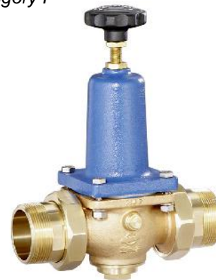
DN 40 - DN 65 (DRV 402-6)