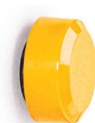
Vue détaillée: profil