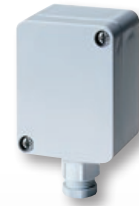
Fühler für Außenmontage Sensor for outdoor mounting