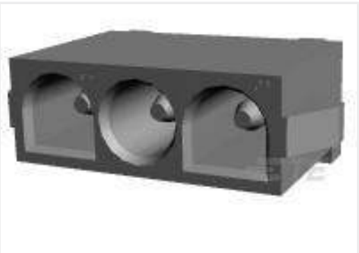
TE Teilnr.:350429-1 03P UMNL PIN HDR ASSY NATL