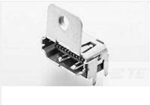
TE Teilnr.:1-1747981-5 Std HDMI, RA, SMT, Panel grd, Flange