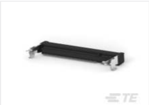
TE Teilnr.:CAT-D3301-SO1339 DDR2-SO-DIMM-Sockel