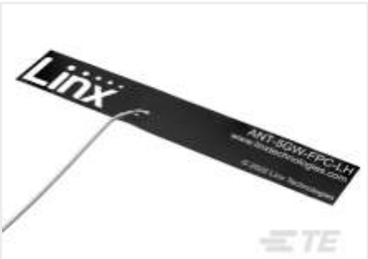
TE Teilnr.:L9000362-01 Antenna 5GW FPC 45x7 1.13 coax 150mm MHF