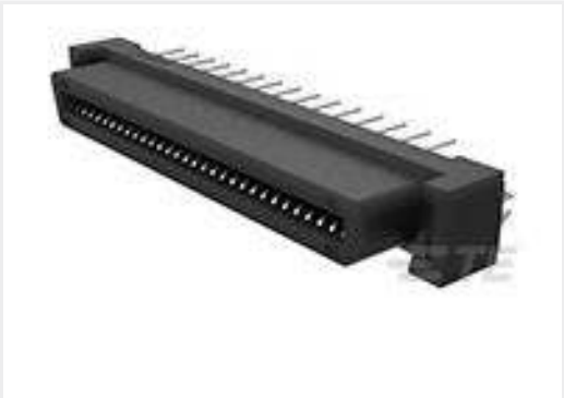
TE Teilnr.:3-5175475-9 CHAMP 050 B/B REC V W/LEG 80P

PCB ANT, MHF 4, 150mm, Wi-Fi TRIPLE BAND