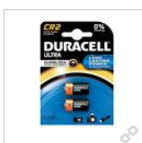
Duracell Ultra Lithium CR2 (CR17355) BG2