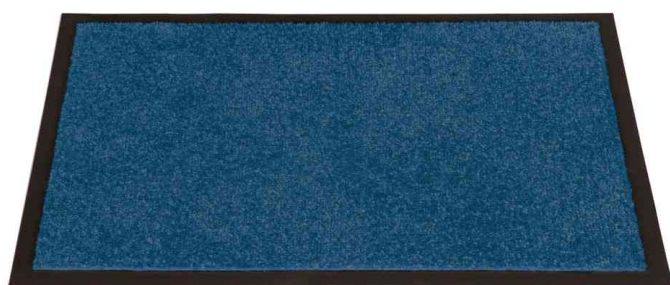
Tapis anti-salissure EAZYCARE BASIC, bleu roy