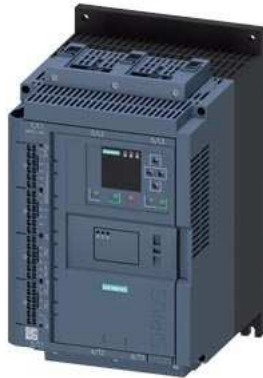
SIRIUS Sanftstarter 200-690 V 93 A, AC 110-250 V Federzugklemmen