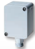
Fühler für Außenmontage Sensor for outdoor mounting