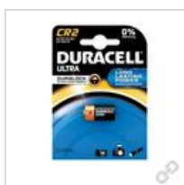
Duracell Ultra Lithium CR2 (CR17355) BG1