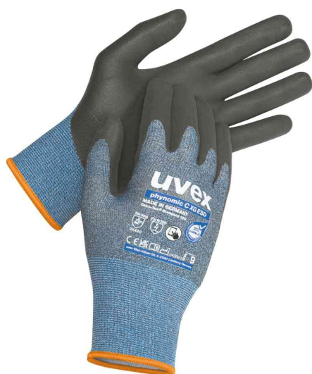
Schnittschutz-Handschuh phynomic C XG ESD

L'expertise en matière de développement, la technologie de pointe des systèmes pilotés par robot et les contrôles de production stricts garantissent la qualité de premier ordre des gants de protection uvex. Des processus de développement entièrement intégrés à toutes les étapes du processus et une production de pointe garantissent une gamme complète - le bon produit pour chaque application.