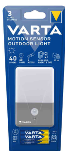
Détecteur de mouvement à LED "Motion Sensor Outdoor Light", pack de 1