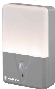
Détecteur de mouvement à LED "Motion Sensor Outdoor Light"