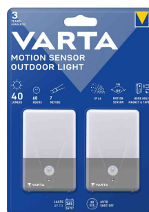
Détecteur de mouvement à LED "Motion Sensor Outdoor Light", pack de 2