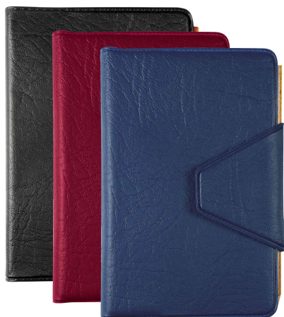
Agenda de poche "Journal 13 Quadrillé", patte velcro, assorti