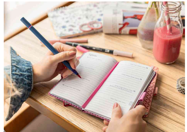
Visuel de référence: présente le produit en utilisation