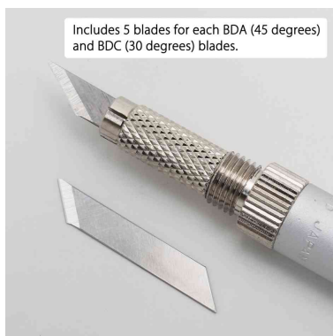
Visuel de référence : vue détaillée de la lame