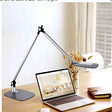
Visuel de référence : montre le produit en utilisation