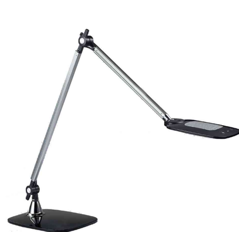
Lampe de table à LED "JIM", argent/noir