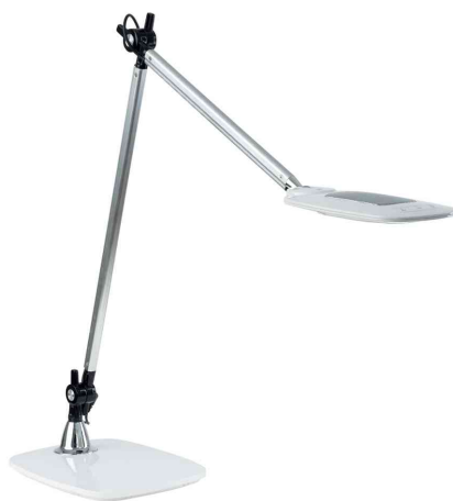
Lampe de table à LED "JIM", argent/blanc