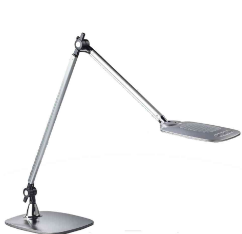
Lampe de table à LED "JIM", argent