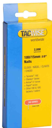
Visuel de référence: clous pour agrafeuse, dans un emballage