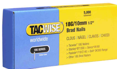
Clous pour agrafeuse/cloueuse 180/10 mm (18G/10)