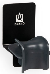
Wandhalter für 1 Transferpette® S Ein- oder Mehrkanalpipette.