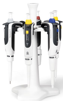
Abb. Pipetten-Paket 2