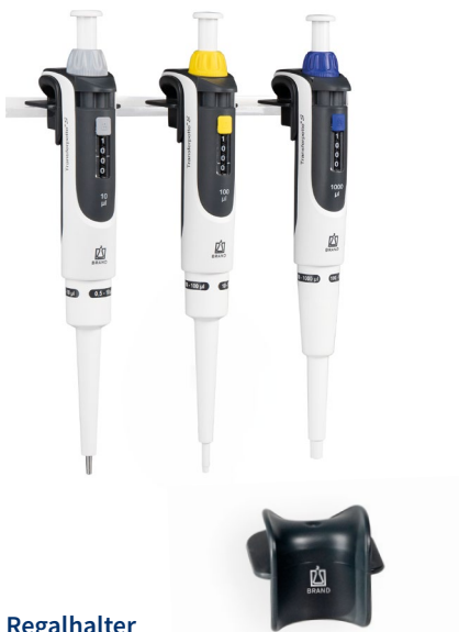
Regalhalter für 1 Transferpette® S Ein- oder Mehrkanalpipette.

Mit den Haltern und Ständern sind die Geräte immer fachgerecht aufbewahrt und griffbereit für den nächsten Einsatz.