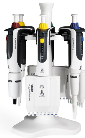
Tischständer Tischständer für 6 Transferpette® S Ein- oder Mehrkanalpipetten.