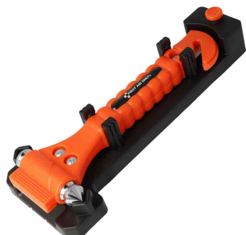
Marteau de secours 2 en 1

- pour briser les vitres des bus, voitures et camions