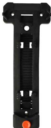
Marteau de secours 2 en 1