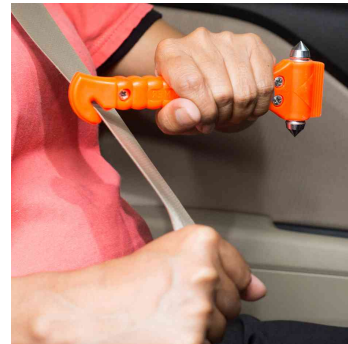
Visuel de référence ; montre le produit en utilisation