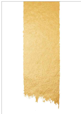
Papier Design "Golden brush stroke"