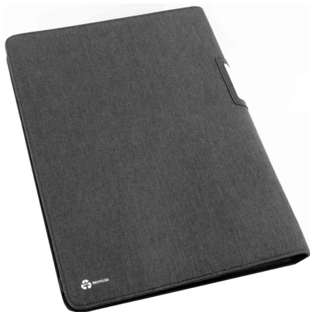
Chemise porte-clés RPET LUZON