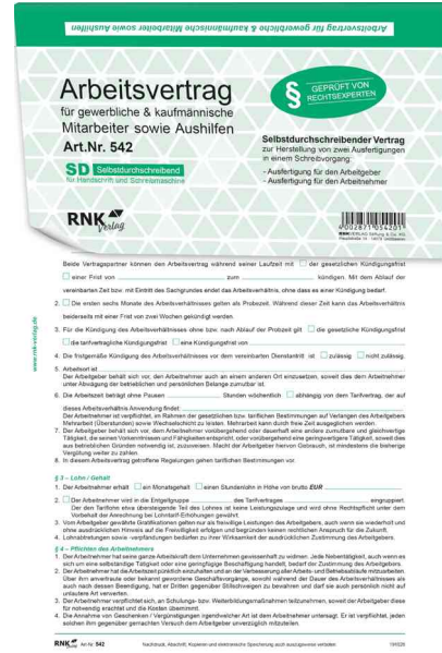
Vordruck "Arbeitsvertrag für gewerbliche & kaufmännische Arbeitnehmer"