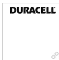
Logo DURACELL schwarz