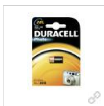
Duracell Lithium 28L (2CR11108) BG1