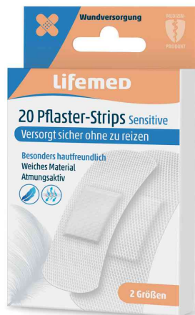
Pansements "Sensitive", pack de 20