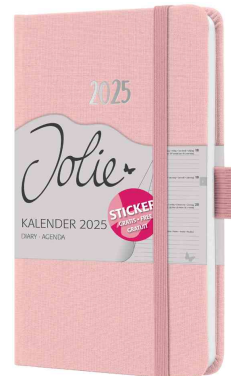
Agenda de poche Jolie "Feel", rose