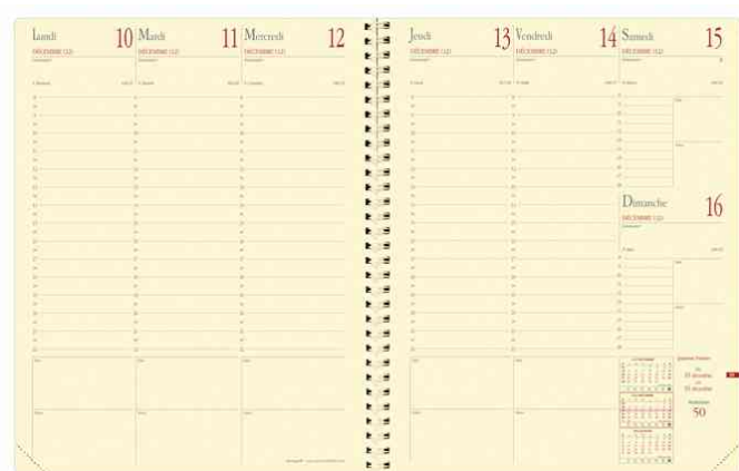
Agenda "Manager" - grille