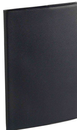
Agenda "Manager", noir