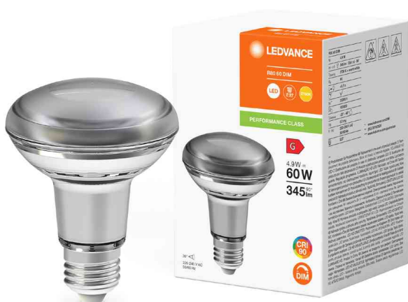
Visuel de référence: Ampoule à réflecteur LED R80 DIM, culot E27

Exemples d'utilisation: - utilisation dans le domaine privé et professionnel - vitrines et panneaux d'affichage - éclairage spot d'objets sensibles à la chaleur tels que les aliments, plantes etc. - utilisations à l'extérieur uniquement dans des luminaires adaptés