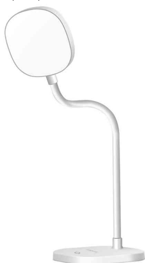
Lampe de bureau à LED avec col de cygne flexible