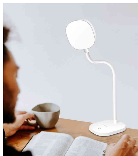
Visuel de référence : montre le produit en utilisation