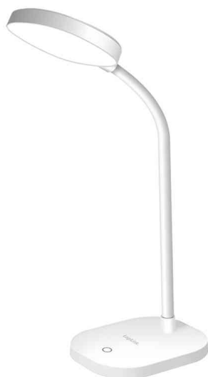
Lampe de bureau à LED avec col de cygne flexible