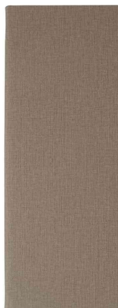
Carte de boissons, beige