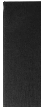
Carte de boissons, noir