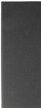
Carte de boissons, anthracite