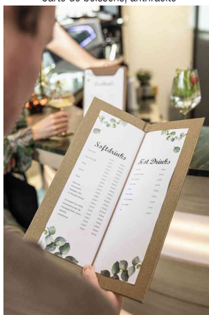
Visuel de référence : montre le produit en utilisation (sans pochettes)