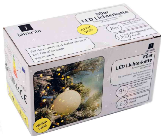
Guirlande lumineuse LED, 80 ampoules