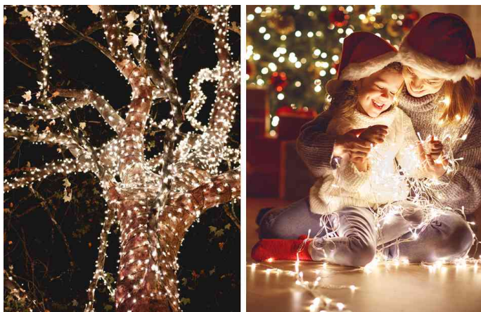
Visuel de référence: montre le produit en utilisation