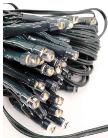
Vue détaillée: ampoules LED