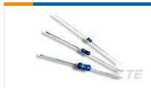
TE Teilnr.:1-1879026-5 YR1 0.1% 143R