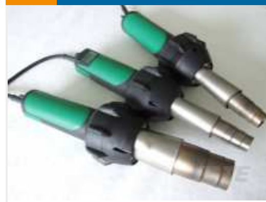
TE Teilnr.: EG1114-000 CV1981-ST-230V1600W-EU