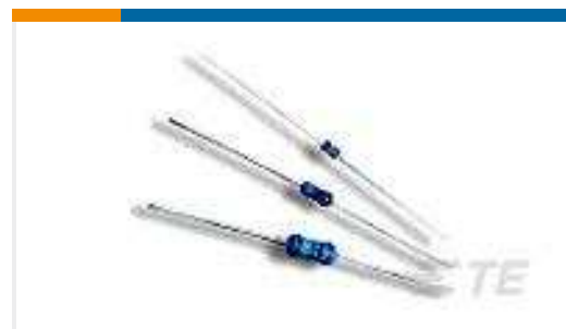
TE Teilnr.:5-1676915-9 YR1 0.1% 115R