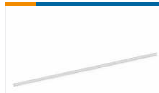
TE Teilnr.:2499356001 Einwandiger CGPT Spulen- Wärmeschrumpfschlauch