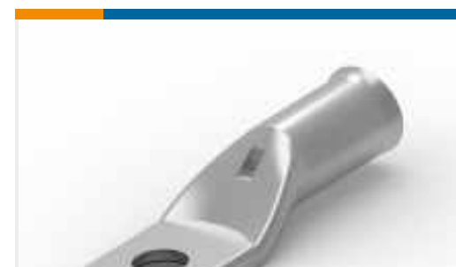
TE Teilnr.:710978-1 XCT 4-5