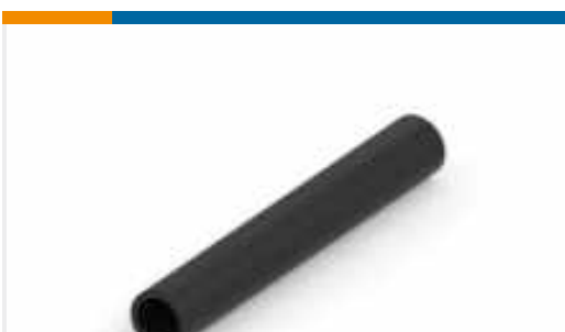
TE Teilnr.:0316676003 LSTT-R-3.2-0